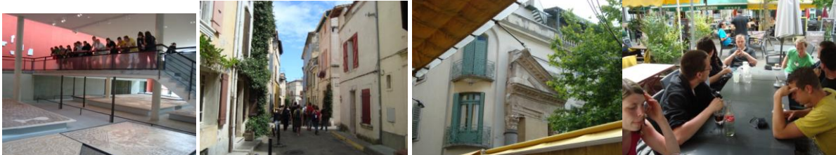
Wir besichtigen noch das alte Fischerviertel La Roquette und sind am Ende ..... in einem Café.